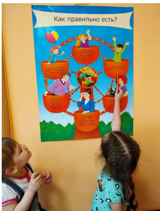
Квест «Полезные продукты»