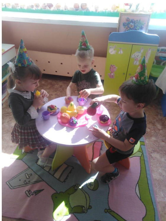
Сюжетно – ролевая игра «День рождения»