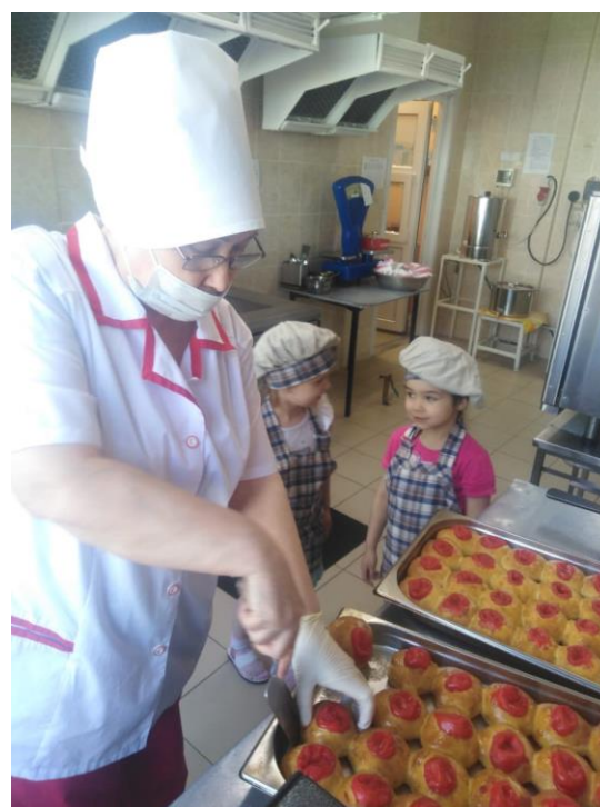
Экскурсия на пищеблок