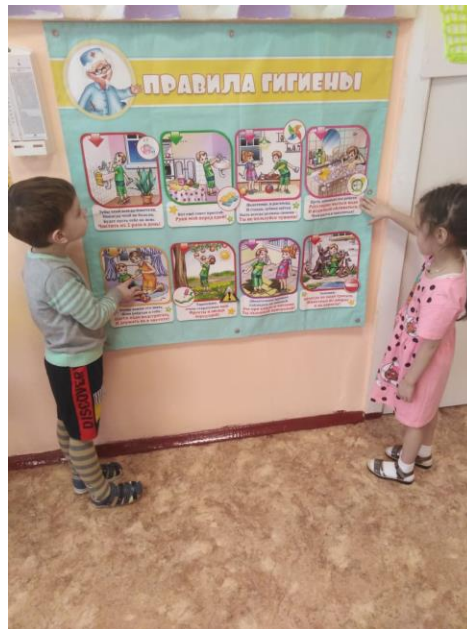
Панно из бросового материала

Подарок от Мойдодыра баннер «Правила гигиены»